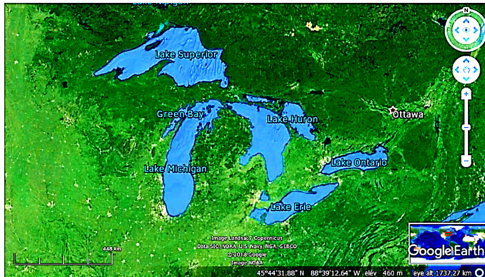
Figura 1. Vista satelital de los grandes lagos.

Los Grandes Lagos (Figura 1) son un conjunto interconectado de cuerpos de agua fresca ubicados entre Canadá y Estados Unidos, formados hace unos 14,000 años, al final del último periodo glacial. Contienen el 21% del agua fresca superficial del planeta, con un volumen aproximado de 22,670 km 3 y cubriendo una superficie de 244,100 km 2 .